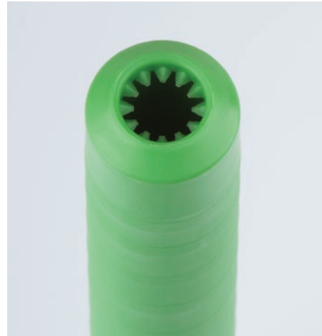
Yakalayıcı dişe sahip kaliteli iplik masuraları Ri-Q-Tube