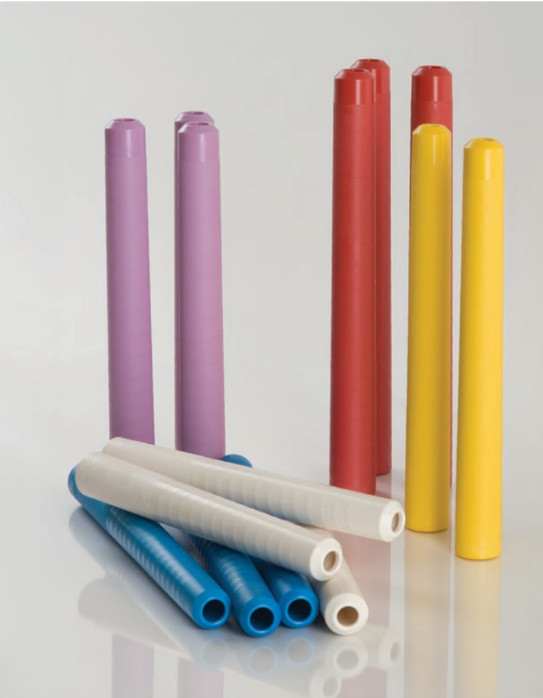
Farklı masura boylarına uygun geniş bir iplik masurası yelpazesi

İplik masuraları 180 mm'den 250 mm'ye kadar farklı masura boylarında mevcuttur. Çeşitli renklerde tedarik edilirler. Ri-Q-Tubes, tüm standart uygulamalarda kullanılırlar. Ham maddeler, pamuk karışımlardan suni ve sentetik elyafa kadar geniş bir yelpazede kullanılabilir. Elastik özlü iplikler ve güçlü kıvrılma eğilimi olan iplikler için kafa içerisinde özel olarak biçimlendirilmiş yakalayıcı dişlere sahip masuralar mevcuttur.