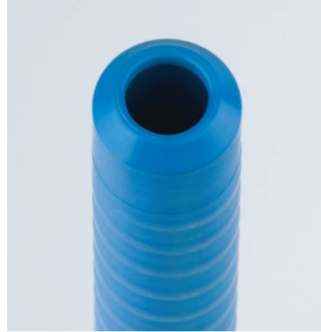
Standart uygulamalar için kaliteli iplik masuraları Ri-Q-Tube