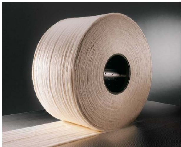
均匀的棉卷成形，更好的纤维定向

OMEGAlap成卷平皮带适用于立达精梳准备机E 35和E 36。可通过立达在线商城ESSENTIALorder轻松订购（零件号为11304539）。配合立达原厂棉卷筒管11101049使用时，其效果最佳。