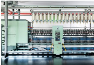
图 1: 借助配备接头机械手 ROBOspin 的全电子锭细纱机 G 38, Beste Spa 可生产卓越品质的纱线。