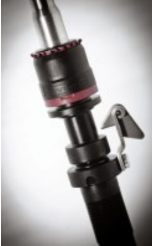
CROCOdoff 'lu LENA

https://rieter.picturepark.com/Website/?AssetId=82294