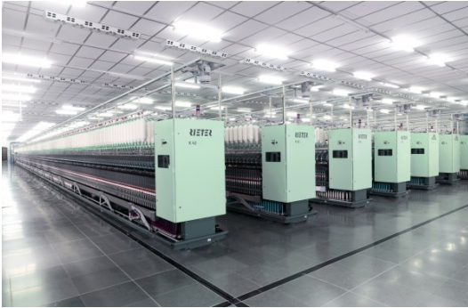
K 42 kompakt iplik makinası

https://rieter.picturepark.com/Website/?AssetId=79477