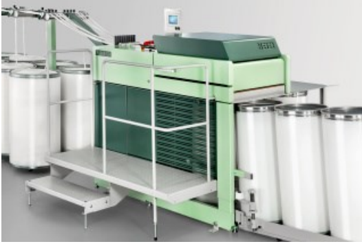
RSB-D 50 Cer Makinası

https://rieter.picturepark.com/Website/?AssetId=79477