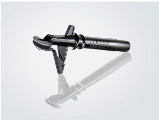
ECOrized emiş borusu

https://rieter.picturepark.com/Website/?AssetId=75169