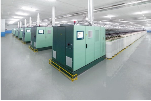
R 36 Open End İplik Makinası

https://rieter.picturepark.com/Website/?AssetId=69537