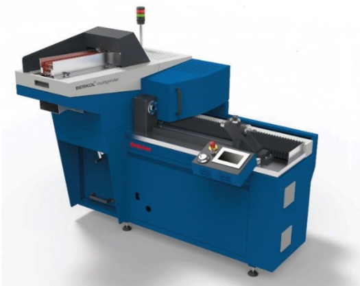
BERKOL® multigrinder MGL taşlama makinası

https://rieter.picturepark.com/Website/?AssetId=69537