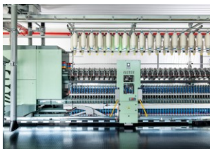
Abb. 1: Mit der vollelektronischen Ringspinnmaschine G 38 mit Anspinnroboter ROBOspin produziert Beste Spa qualitativ hochwertige Garne.