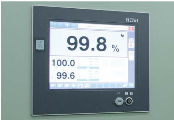
银华纺织机器的运行达到理想状态：99.8%的机器效率