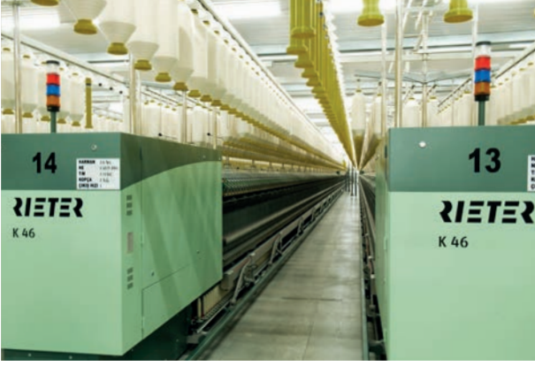
K 46 Kompakt İplik Makinaları