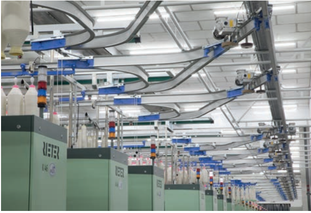
紧密纺纱机K 46配备粗纱纱管运输系统SERVOtrail